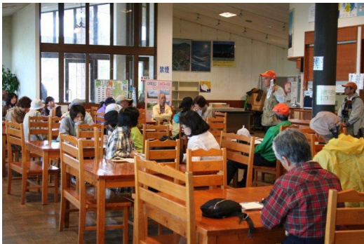
レストハウスでの講義