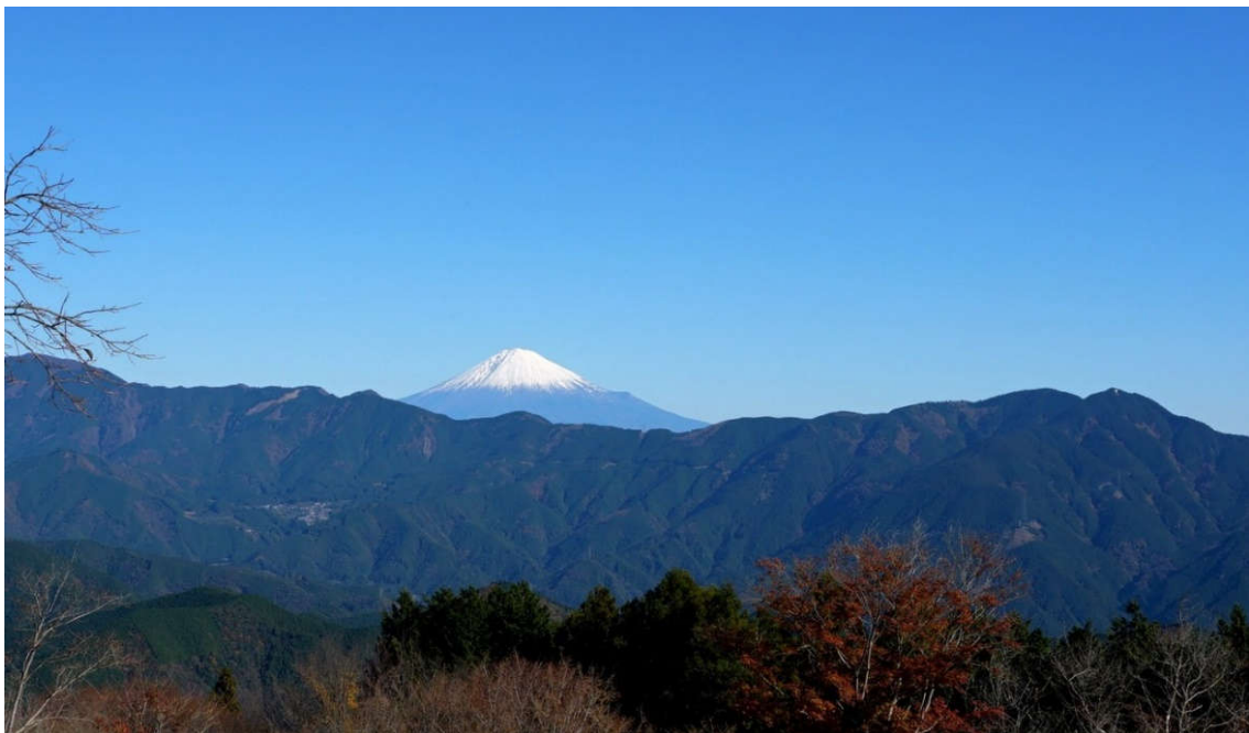
雨上がりの快晴のもと、富士山がきれいに見えました