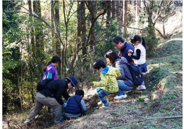
皆で冬イチゴを探しました