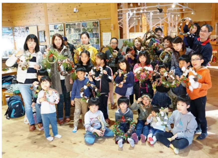
皆で自分の作品を持って写真を撮りました