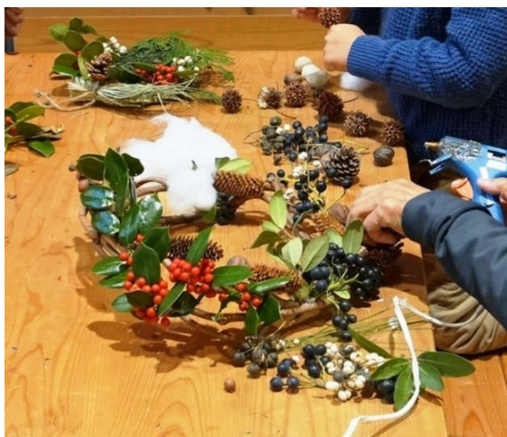
クールガンと針金で飾付しました