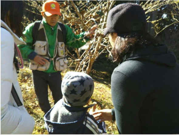
寒い冬を過ごす冬芽の説明しました